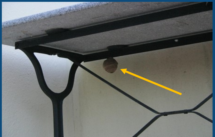
Nid primaire de frelons asiatiques sous une table en extérieur.

Sinon, la reine se déplacera là où elle pourra construire un nouveau nid, sans limite d'espace, appelé nid secondaire. Celui-ci sera installé très souvent en haut d'un arbre, sans que cela soit exclusif.