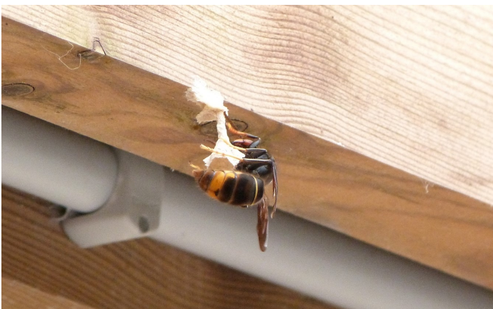
Une reine est en train de construire son nid dans lequel elle élèvera seule les premières ouvrières de sa future colonie.

Pour réduire ce sentiment de peur et les risques sanitaires liés à la période d'activité des frelons, une stratégie consiste à détecter le plus tôt possible les nids primaires pour les détruire, et diminuer ainsi la présence future de gros nids secondaires pendant la belle saison (fin printemps – été – début automne).