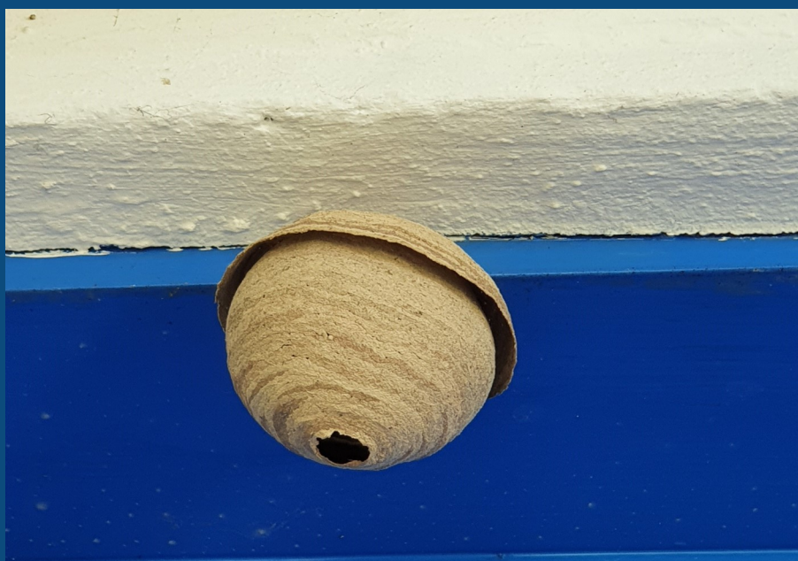
Un nid primaire de frelon asiatique, construit par la seule reine.

Nous n'évoquons pas souvent le Frelon à pattes jaunes ( Vespa velutina nigrithorax ) dans cette lettre d'information. Cet insecte invasif n'est pas réglementé au titre de la santé humaine, mais en raison de ses impacts sur la biodiversité et sur l'apiculture.