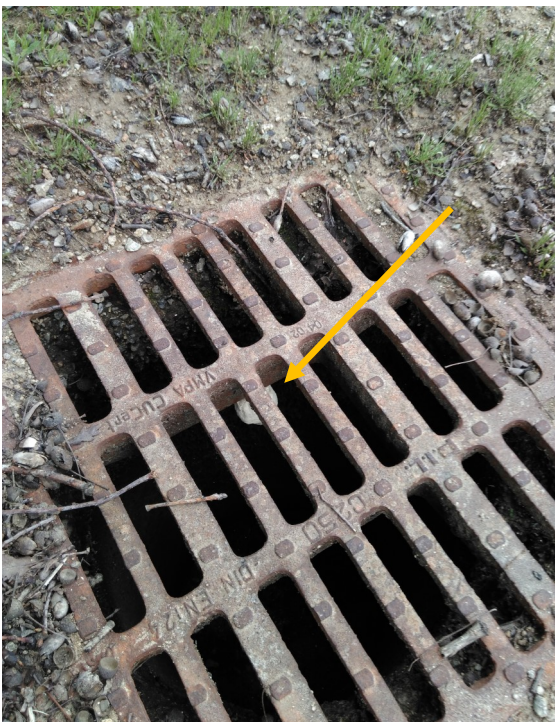
Nid primaire de frelons asiatiques sous une plaque d'égout. Il fallait y penser.