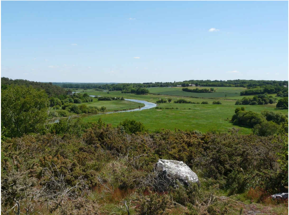
La vallée du Don à l'amont de Massérac vue du rocher du veau