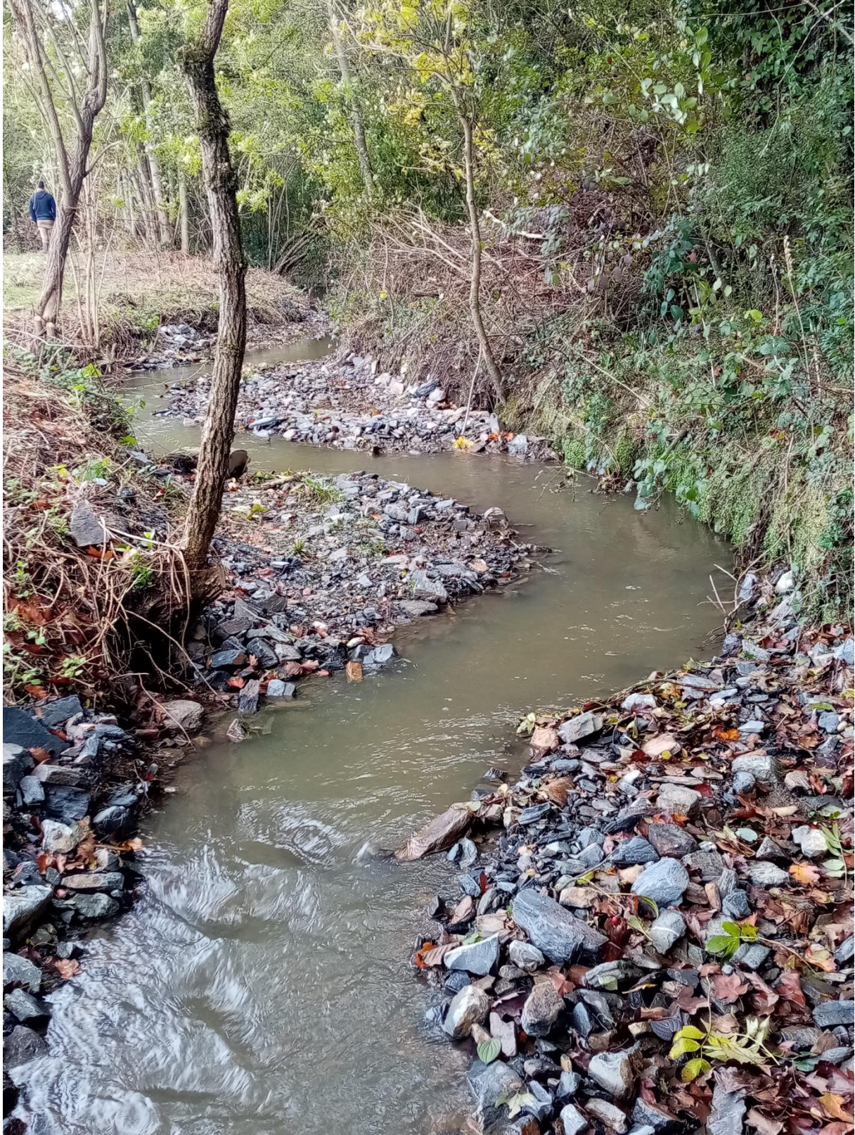
Travaux effectués sur le ruisseau du Méguinel